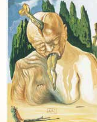
▲「ダンテ(神曲)天国篇第9歌 第三天(金星天)」サルバドール・ダリ/1960年