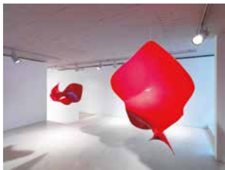
▲「開眼(鳥のさえずり)」2012年