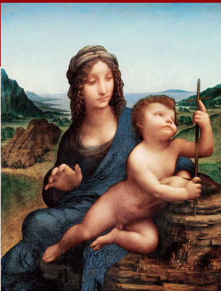
レオナルド・ダ・ヴィンチ「糸巻きの聖母」(1501年頃)

日本初公開の絵画「糸巻きの聖母」と直筆ノート「鳥の飛翔に関する手稿」を中心に紹介します。2点とも、「見えない世界」を探ろうとしたダビンチによる人間観察・自然研究が集約された円熟期の傑作とされます。イタリアが生んだ天才の挑戦に触れることができる貴重な展覧会です。 開催日 2016年1月16日(土)~4月10日(日) 時間 9:30~17:30(最終入館は30分前まで) ※土曜日は19:30まで 休館日 毎週月曜日(ただし、1月18日、3月21日・28日は開館、3月22日(火)は休館) 会場 江戸東京博物館 1階特別展示室(東京都墨田区横綱1-4-1) チケット(税込価格) 一般/1,450円 大学生・専門学校生/1,160円 小・中学生・高校生・65歳以上/730円