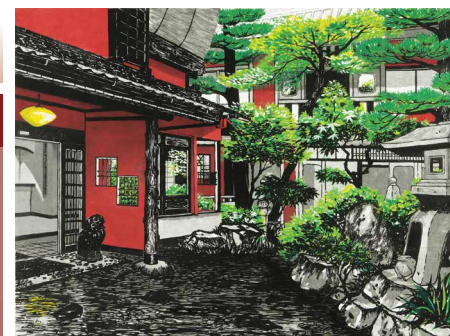
「紅樓依緑」2005年(第37回日展特選)