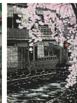
「桜薫白川」2004年(第80回記念李白日展出品)