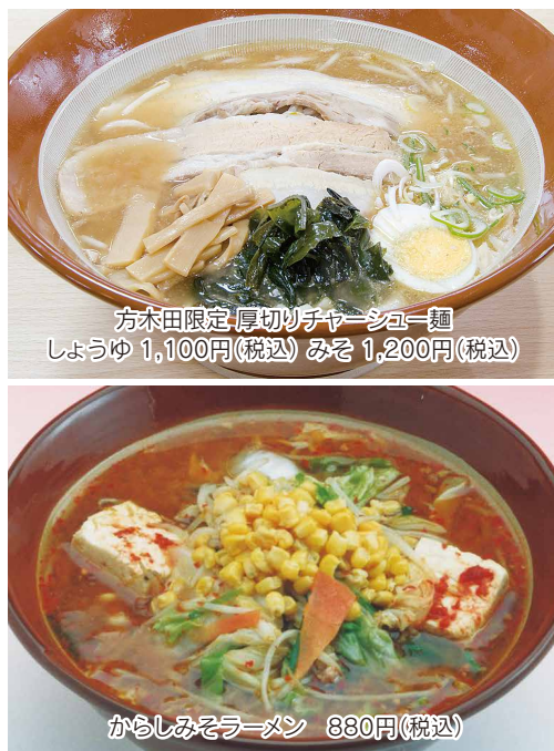
方木田限定「厚切りチャーシュー」 しょうゆ 1,100円(税込) みそ 1,200円(税込)

福島市小倉寺字竹ノ内6-1 TEL.024-521-0137 営業 11:00~19:30 休 毎週木曜日 台 5台