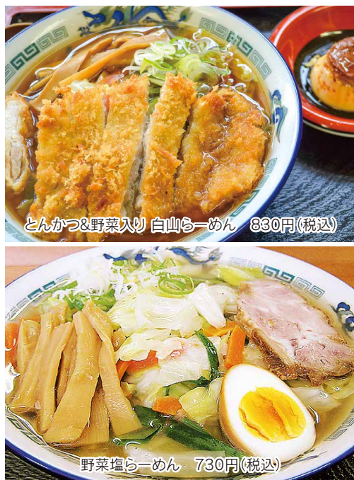
とんかつ&野菜入り 白山らーめん 830円(税込)