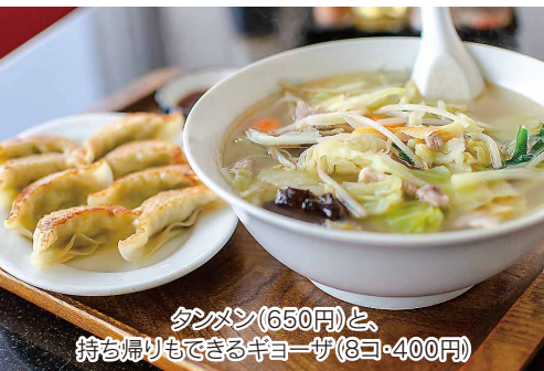
タンメン(650円)と、持ち帰りもできるギョーザ(8コ・400円)

福島市内の飲食店をご紹介します!各店舗のおすすめメニュー(TAKEOUT商品含む)や取り組んでいる感染予防対策をご紹介します。