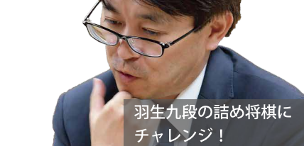
羽生九段の詰め将棋にチャレンジ!

毎小を読んだら「興味が広がった」83% いろんなことに興味が出てきた 83.1%