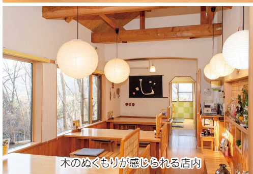
木のぬくもりが感じられる店内