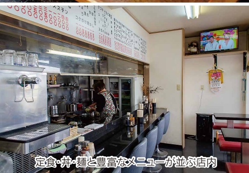
定食・丼・麺と豊富なメニューが並び店内